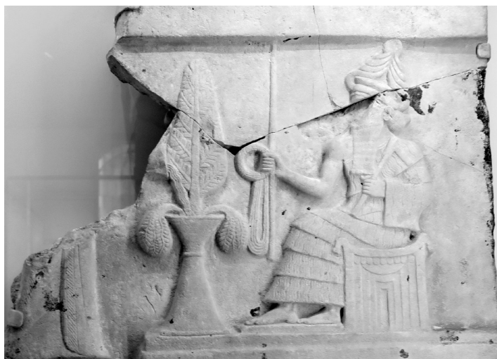
FIG. 5. – Le dieu Nanna sur son trône. Ce fragment d’une stèle d’Ur-Nammu, roi d’Ur au début du XXI e siècle av. J.-C., peut donner une idée du trône offert par Samsu-iluna (Penn Museum, Philadelphie).