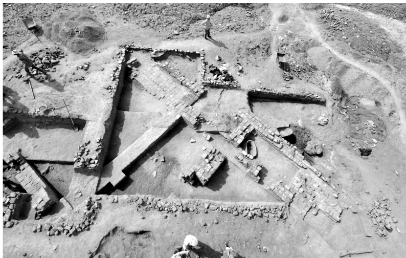
FIG. 6. – Vue de la maison de Sin-nada (chantier A).

comporte après son nom quatre lignes, dont les trois premières indiquent qu'il est « 2 fils de Igi-anakezu, 3 scribe, 4 intendant du temple de Ningal ». Ce sceau a été déroulé sur des étiquettes en argile ayant servi à fermer divers contenants, mais aussi sur des enveloppes de lettres dont des fragments ont été retrouvés. À l'époque, en effet, lorsque l'argile de la tablette sur laquelle la lettre avait été inscrite était devenue sèche, on la recouvrait d'une fine couche d'argile formant une enveloppe. Celle-ci garantissait la confidentialité du message, puisque seul le nom du destinataire y était inscrit ; l'expéditeur y déroulait son sceau, ce qui assurait l'authentification de la lettre 31 . Or une des lettres retrouvées dans la maison était adressée à une femme nommée Nuṭuptum, très vraisemblablement l'épouse de Sin-nada : après avoir dressé la liste des objets qu'il lui faisait parvenir, il ajoutait qu'il rentrerait dix jours plus tard. Le fait que Sin-nada ait été, non pas le destinataire, mais l'expéditeur d'une lettre retrouvée dans cette maison n'empêche donc pas qu'il en ait été l'occupant principal 32 .