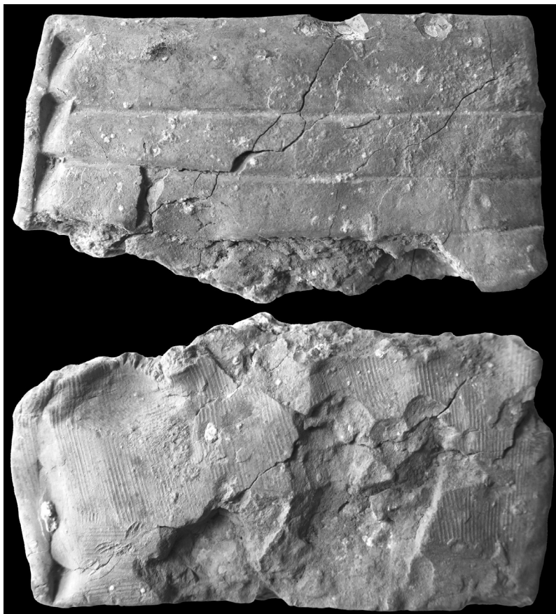
FIG. 8. – Tablette scolaire du chantier 4 (face et revers).

traduire, par opposition à la connaissance savante du cunéiforme, réservée à quelques-uns 40 .