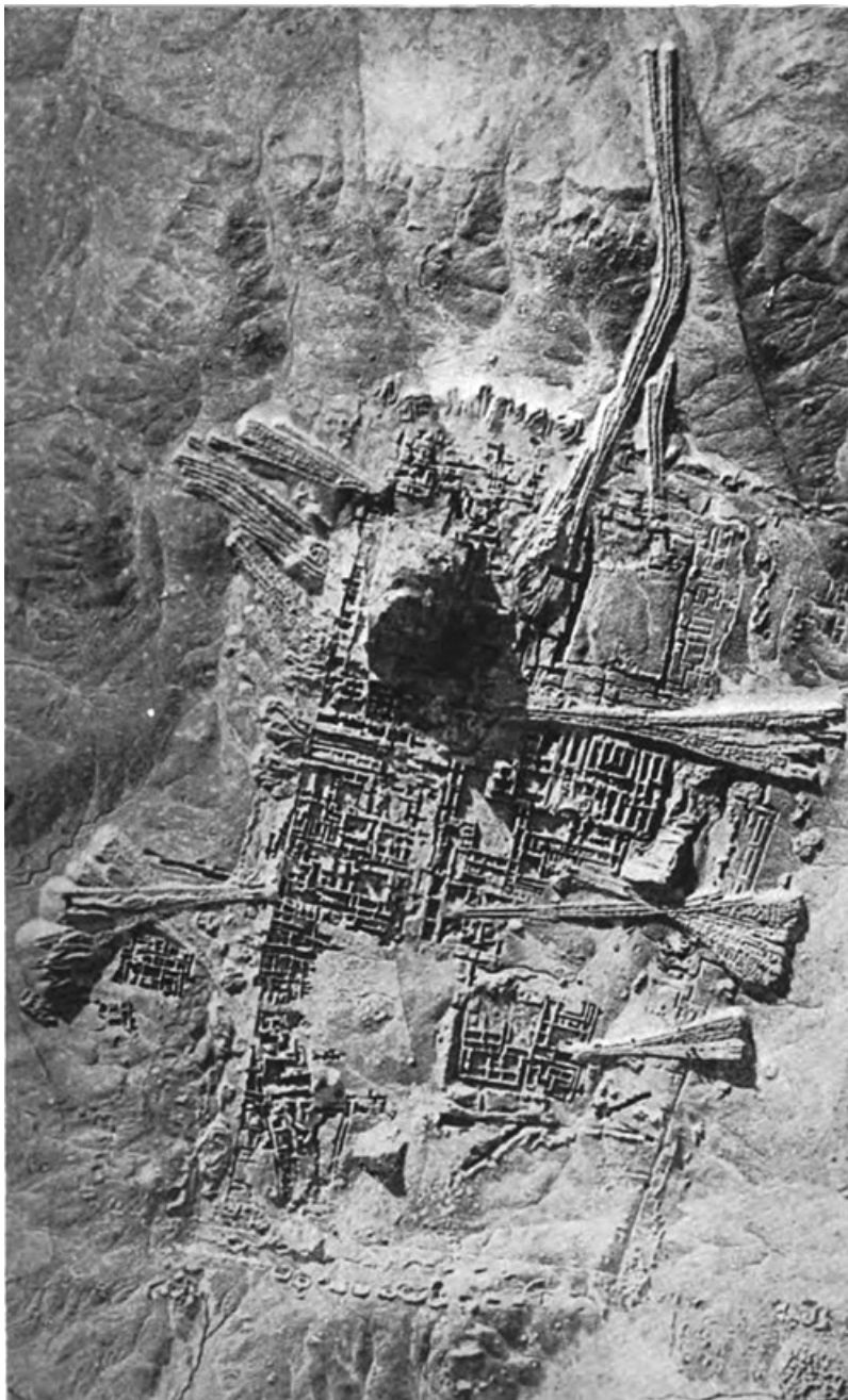
FIG. 1. – Vue aérienne du site d'Ur (cliché Royal Air Force , 1927).