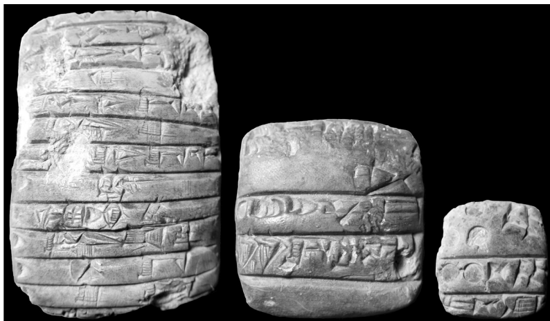
FIG. 2. – Tablettes de l'époque d'Akkad découvertes dans le chantier 2.