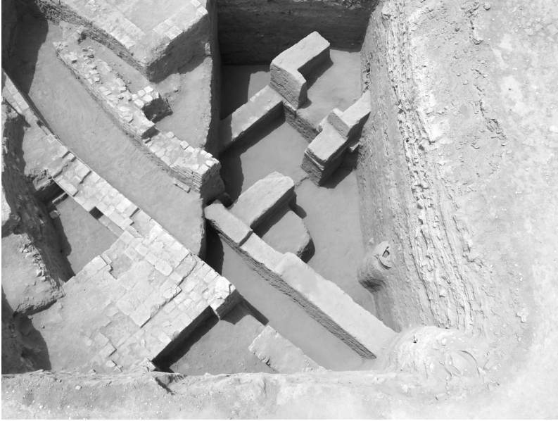
FIG. 7. – Vue d'ensemble du chantier 4.

Ce chantier a d'abord permis de retrouver dans une demeure paléo-babylonienne des tablettes scolaires, dont beaucoup portaient les traces de recyclage courantes pour ce genre de textes (fig. 8) : une fois l'exercice achevé, on réutilisait l'argile pour un autre travail 38 . Une tablette a même été annulée par une croix. Tous les exercices retrouvés jusqu'à présent dans ce locus relèvent d'un enseignement d'initiation. Ils sont néanmoins très importants, car ils confirment ce que les assyriologues sont de plus en plus nombreux à penser, et que j'avais exposé à cette Compagnie en 2004 : la connaissance du cunéiforme n'était pas réservée à une petite caste de spécialistes, les scribes, mais les membres de l'élite étaient généralement capables de lire et en cas de besoin d'écrire 39 . C'est ce que Niek Veldhuis a récemment désigné comme functional literacy , terme difficile à