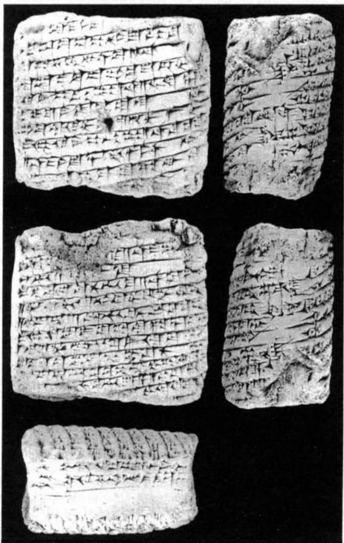
A.3823

zwischen der Situation der Zeit Zimri-Lims und der vorhergehenden unterschieden werden, als Yasmaḥ-Addu Mari regierte. Wir werden sehen, wie Yasmaḥ-Addu, der von klein auf akkadischsprachig aufgewachsen war, sich bereit erklärte Amurritisch zu lernen, nachdem sein Vater sich über seine Unkenntnis mokiert hatte.